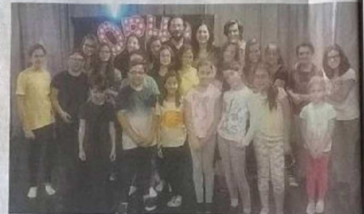
I giovanissimi allievi della Compagnia Godot